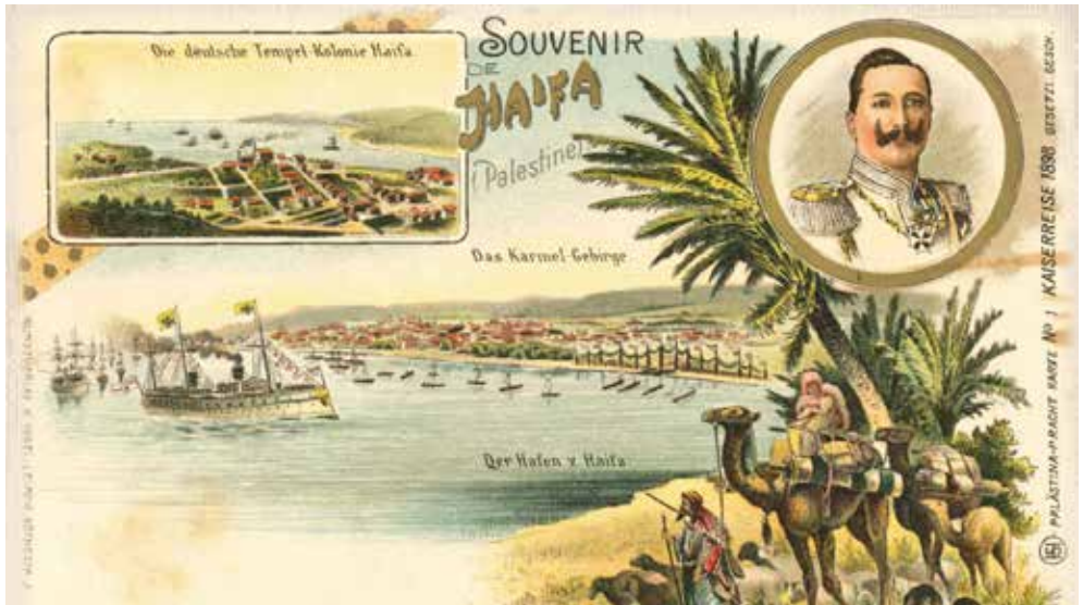
Ansichtskarte anlässlich der Reise des deutschen Kaisers nach Palästina.