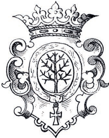
Das Wappen der Familie de Cheusses. 35