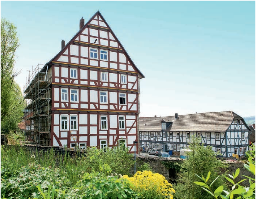
Burgsitz in Spangenberg, der einst der Familie von Lindau gehörte.