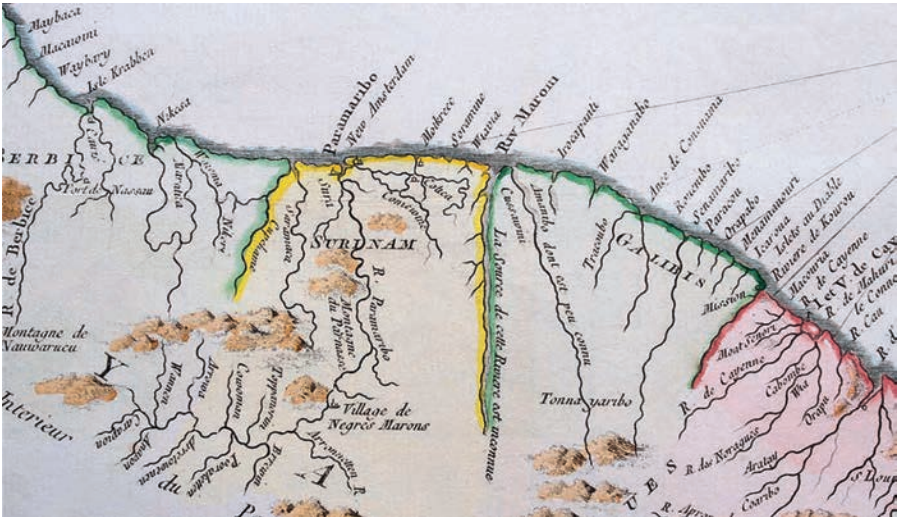
Karte Guyanas und Surinams aus „L' Histoire générale des Voyages“ 1753.