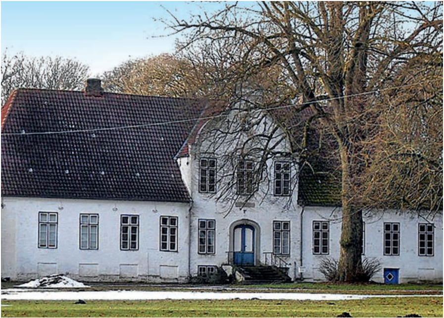
Das Herrenhaus des Guts Lütchenhorn.